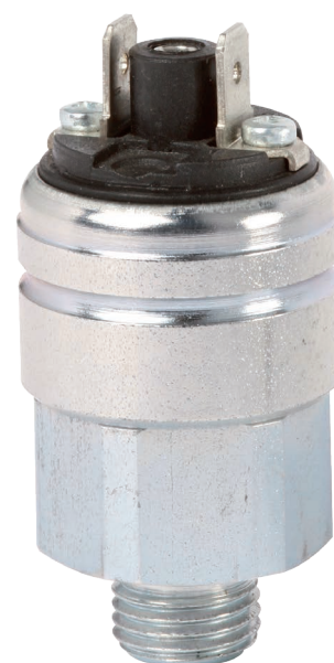
Pressostato compatto OEM, versione base, modello PSM06